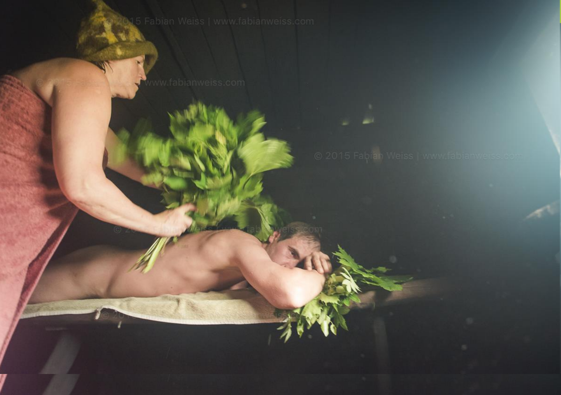
Eda Veeroja Mooska talo