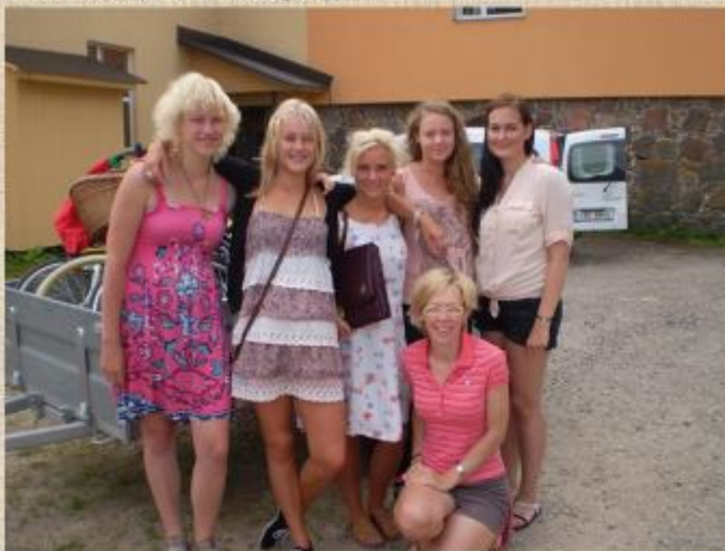
Vahtseliina khlk Viitkal 2013, TÜ tudengid.

2011 Urvaste kihelkonnas Urvaste ümbruses (TÜ tudengid), 2012 Pühajõe ja Võhandu ääres olevad suitsusaunad (2 tudengit), 2013 Vahtseliina kihelkonna Viitka ümbrus (TÜ tudengid).