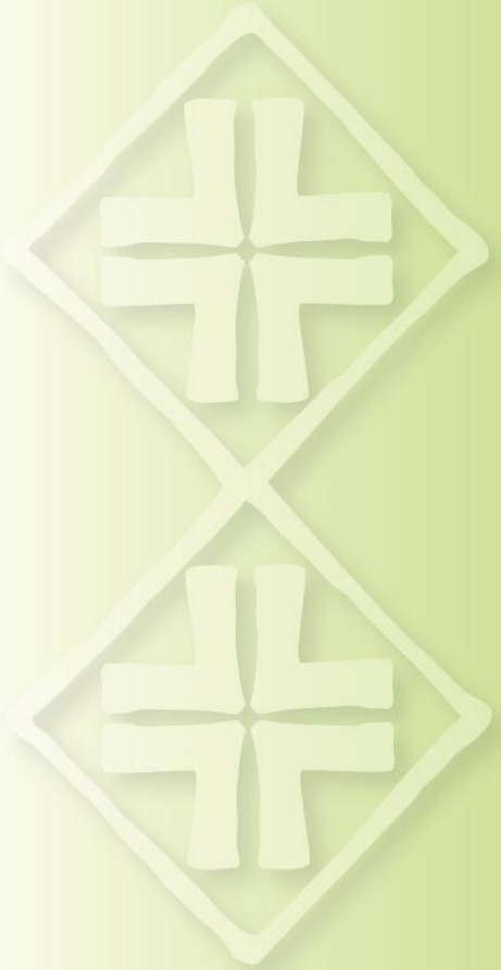
Eda Veeroja Mooska talo