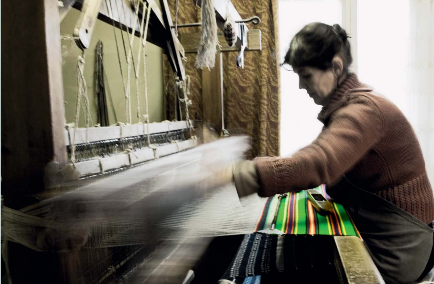
☞ Rahvariideseeliku kanga kudumine on täpne töö.

Hiidlaste kogemused ja järelused on paljuski 2010. aasta novembris avatud Eesti vaimse kultuuripärandi nimistu toimimispõhimõtete aluseks. Kodulehe ülesehitus sündis aga Eesti Kirjandusmuuseumi, Eesti Rahva Muuseumi ja Tartu Ülikooli ekspertide ning Rahvakultuuri Keskuse vaimse pärandi spetsialistide koostöös. Esimesed sissekanded tegid nimistusse hiidlased ja võrokased. Esimeste jaoks oli see 2007. aastal alanud protsessi loogiline jätk, kuid ka Võromaal on juba pikemat aega pööratud tähelepanu vaimse kultuuripärandi hoidmisele ja edasiandmisele.