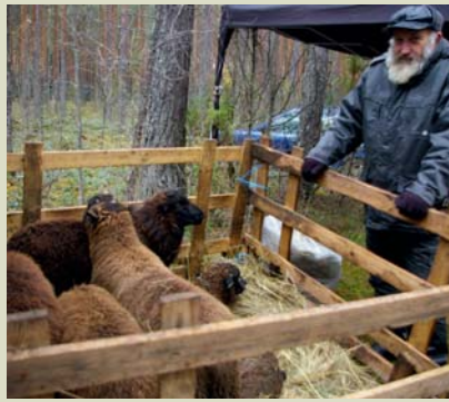
Õlleheaju, Urma leht

Algusaegadel kaubeldi Lindoral põhiliselt koduloomadega. Hiljem hakati müüma ka käsitööd ja aiasaadusi. Tänapäevalgi müüakse lambaid, põrsaid, kitsi, jäneseid, hanesid, kanu, kassipoegi ja kutsikaid. Söögikraamist lähevad kõige paremini kaubaks lambaliha ja suitsulihatooted. Loomulikult on turgu aiasaadustel. Kaubeldakse veel käsitöö ja vanakraamiga ning pakutakse mitmesugust tööstuskaupa.