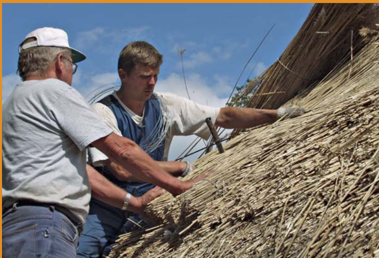
Projekt „Rahvakultuuri kohtuvad“