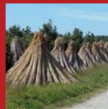
Vaimne kultuuri- pärand